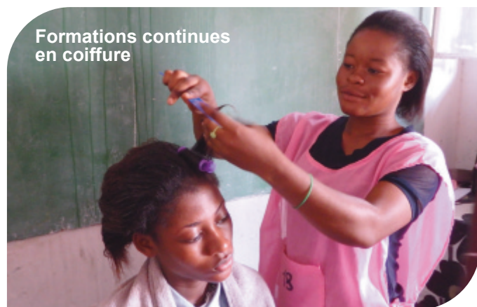
Formations continues en coiffure

AECOM a toujours mis l'accent sur la formation dans ses projets, ce qui coïncidait très bien avec la stratégie d'intervention de l'AMU. Actuellement, nous soutenons un projet de renforcement des capacités pour des jeunes adultes en offrant des formations continues gratuites. Ce projet a connu dès le début une très forte demande de la part des jeunes. Il y a même des listes d'attente pour certaines formations. Lors de notre visite, nous avons eu la chance de visiter les formations en coiffure, en esthétique ainsi qu'en couture. Les participants nous ont beaucoup remercié pour cette opportunité et nous ont parlé de leur motivation et de leurs plans pour le futur. A Kinshasa, la majorité des jeunes n'ont pas accès à des formations professionnelles, souvent par défaut de moyens.