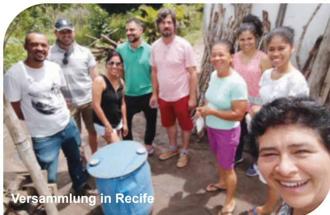
Versammlung in Recife

Geboren war somit die Idee unseren Partnern die Möglichkeit zu bieten, Treffen in den verschiedenen Projekten zu organisieren. Während eines ersten Treffens im November 2018 kamen Partner aus dem Kongo, aus Uganda und aus Tansania zusammen. Alle drei Partner betreiben ein Krankenhaus, haben jedoch den Schwerpunkt teilweise auf unterschiedliche Themengebiete gelegt. Während die drei Krankenhäuser die verschiedensten Leistungen anbieten, liegt in Uganda der Schwerpunkt beispielsweise eher auf einem HIV/AIDS Projekt, in Kinshasa hingegen auf der Geburtenstation und in Dar es Salaam im Bereich der Mangelernährung. Dies ermöglichte es den Partner, viel voneinander zu lernen, sie deckten Gemeinsamkeiten und Unterschiede auf und erarbeiteten gemeinsam Verbesserungsvorschläge.