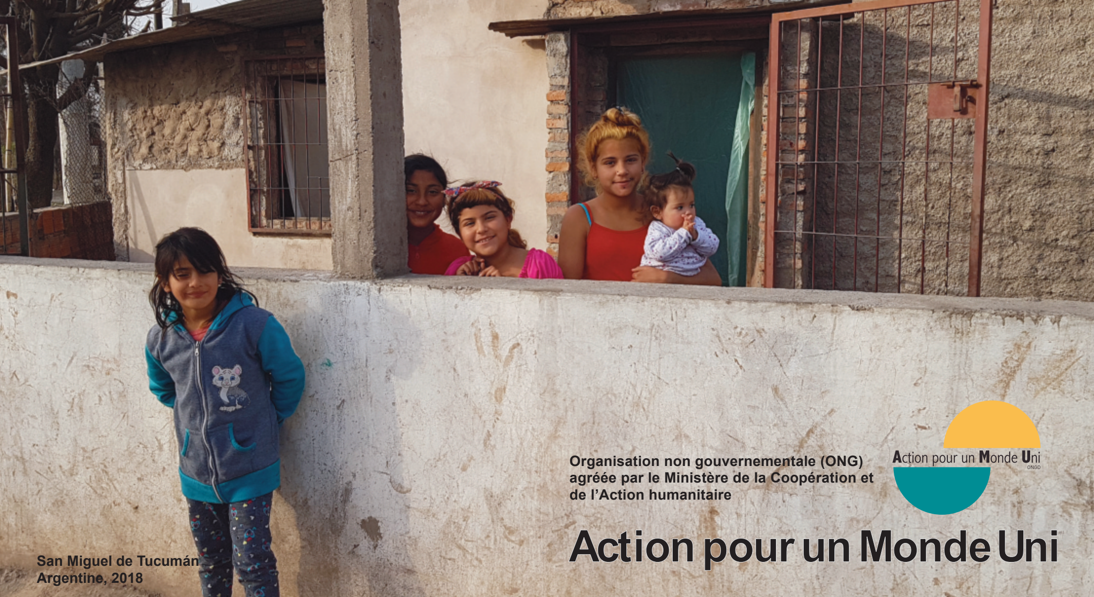
San Miguel de Tucumán Argentine, 2018

Organisation non gouvernementale (ONG) agrée par le Ministère de la Coopération et de l'Action humanitaire