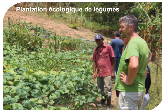
Plantation écologique de légumes

En 1997, des personnes « Sans Terre », comme on les appelle au Brésil, se sont installées sur des terres dans la région Pernambuco pour lutter pour leur droit de propriété. Ces paysans pauvres ont lutté dans le cadre d'une réforme agraire pour que l'État leur attribue des terres afin de pouvoir vivre de leurs propres cultures et de pouvoir nourrir leurs familles. Finalement, en 2003 l'État brésilien a donné son accord pour la remise de terres à 250 familles réparties dans ces 5 communautés. Chaque famille a reçu un lot de 6, 7 ou 8 ha.