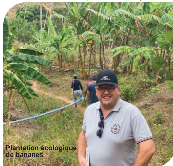
Plantation écologique de bananes

CPT, la Commission Pastorale de la Terre, notre partenaire sur place, accompagne ces familles depuis 2003 dans un processus d'apprentissage pour cultiver ces terres par des méthodes de production agro-écologiques. Il s'agit d'un processus très lent et difficile puisque, depuis des générations, les gens ne connaissent que les monocultures de canne à sucre et l'utilisation de produits chimiques.