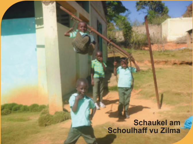
Schaukel am Schoulhaff vu Zilma

Mir hunn en héichrangege Korruptiker kennegeléiert an hunn eis och schonn e Bild vun der krimineller Hauptstadt Port-au-Prince gemaach, wou Milliounen vun extrem Aarme mat e puer Gangsteren, auslännesche Geschäftsleit a räiche Politiker zesumme-liewen. Fir eise Visa ze verlängeren, ware mer och eng Kéier eng kleng Vakanz an d'Nopeschland Dominikanesch Republik maachen, wou ee soubal een iwwert déi iwwerlaffe Grenz ass, sech erëm an engem plus/minus organiséierte Land befënnt. Fir de Rescht këmmere mer eis em eisen Haushalt a setze mat den Haitianer ronderëm.