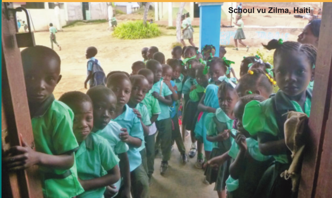
Schoul vu Zilma, Haiti