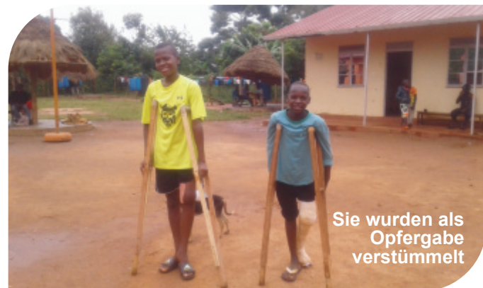
Sie wurden als Opfergabe verstümmelt