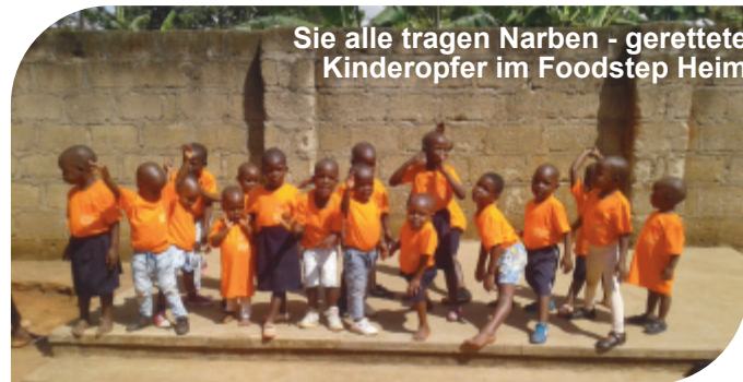
Sie alle tragen Narben - gerettete Kinderopfer im Foodstep Heim