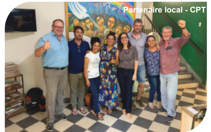
Partenaire local - CPT

L'agro-industrie est prédominante au Brésil. La région de Pernambuco est un des plus grands producteurs de canne à sucre au Brésil. La canne à sucre est plantée selon une période de production de 5 ans. La récolte dans cette région se fait à la main, vu que le paysage vallonné ne permet pas l'utilisation de grandes machines comme dans d'autres régions du Brésil. Il s'agit d'un travail très dur et souvent les gens travaillent jusqu'à 12 heures par jour. Les salaires payés par l'agro-industrie sont très bas. Tellement bas, que notre ONG partenaire parle même d'une forme d'esclavage moderne. Pour rendre plus efficient la récolte à mains, les champs sont brûlés ce qui provoque énormément de problèmes respiratoires chez les travailleurs. De plus, la biodiversité a complètement disparu de cette région et le fait que la canne à sucre soit plantée sans alternance avec d'autres cultures a appauvri complètement les terres, nécessitant des quantités énormes de pesticides et d'engrais. Le mot « catastrophe écologique » ne peut être mieux choisi pour décrire l'exploitation des milliers de ha à Pernambuco.